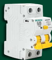
محافظ جان مولتی فانکشن