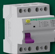
محافظ جان (RCCB) 6000